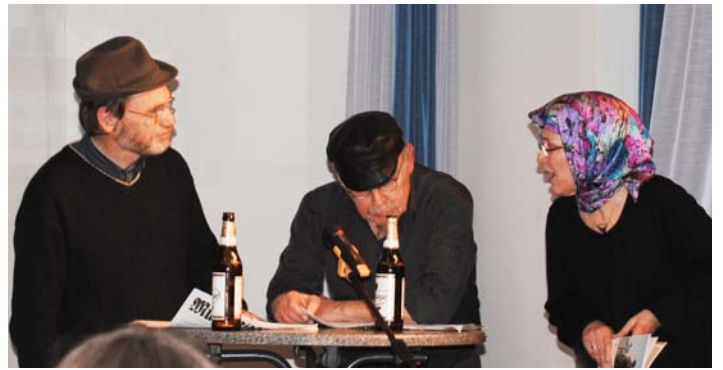
»Die Moslems sind an allem schuld.«