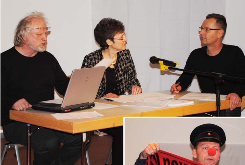
Basisdemokratische Debatten: die Vogelhäuschenbeauftragte sorgt sich um die geschlechterneutrale Fütterung im Winter.