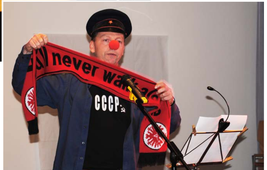
Echte Karnevalsstimmung: »De Kommunismus de hat ene Rhythmus ...«