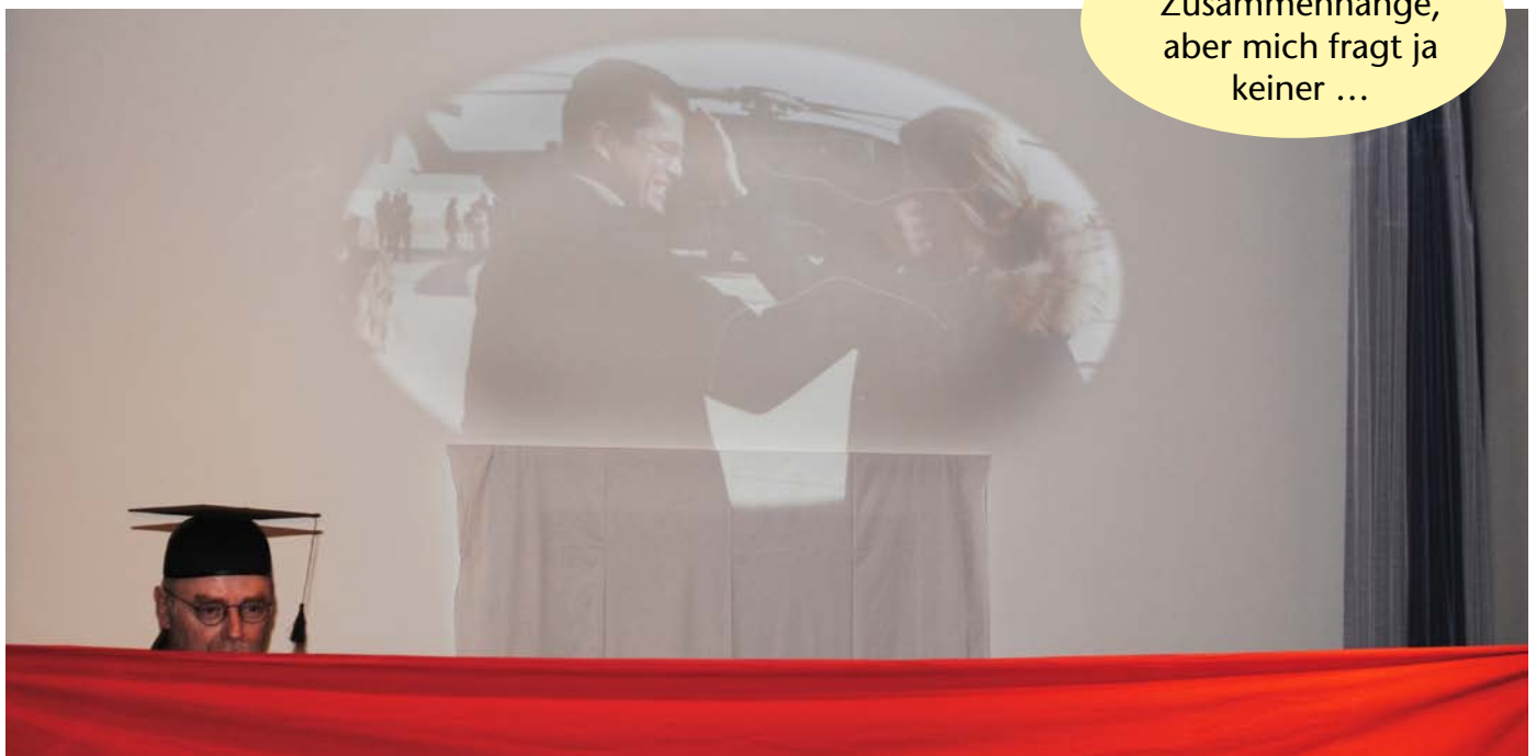
Raubkopierern drohen Freiheitsstrafen von bis zu fünf Jahren – oder der Verlust des Dokortitels.