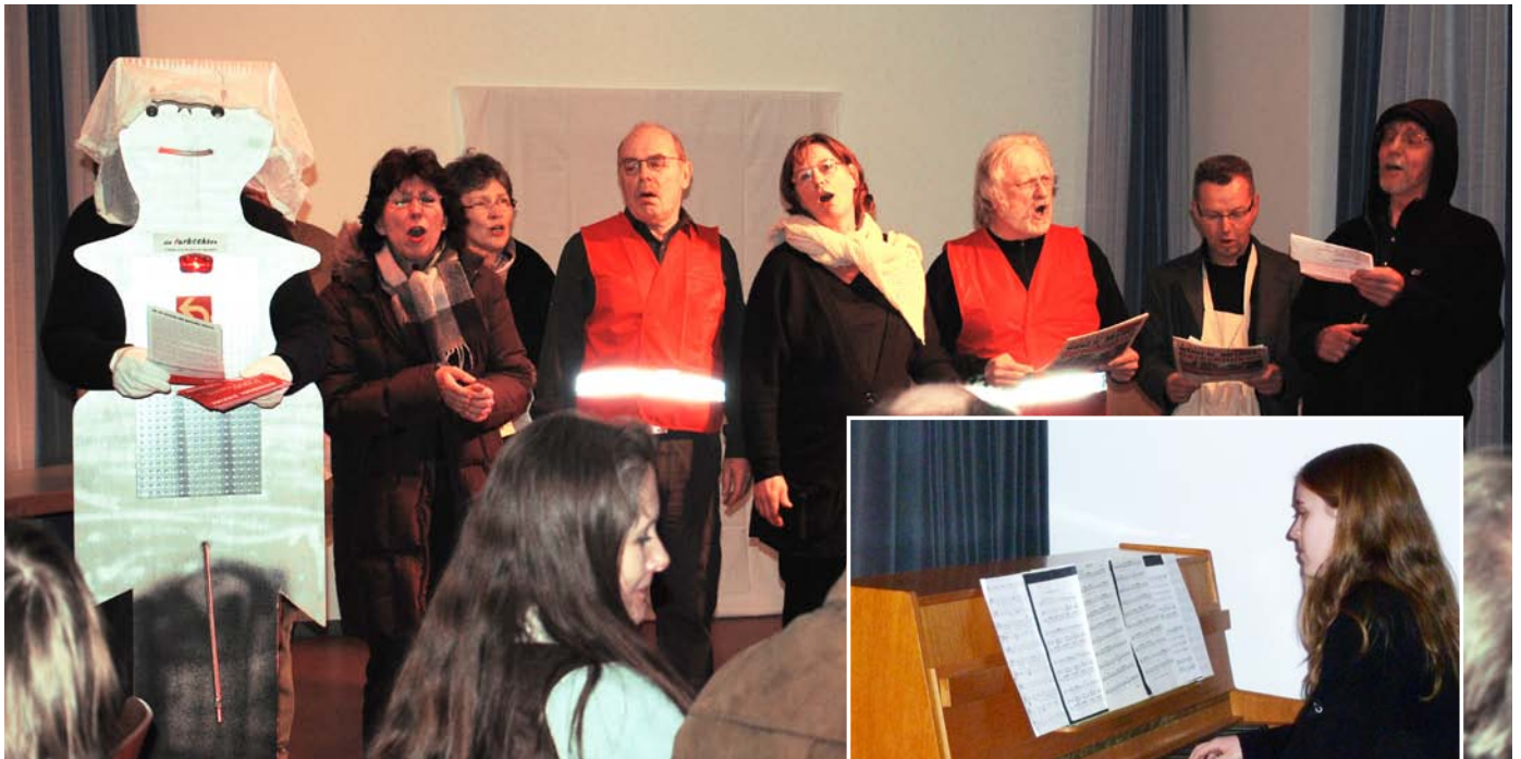
»Endlich wieder Wahlkampf« – zur bekannten Melodie aus Anatevka wurde die Veranstaltung musikalisch eröffnet.