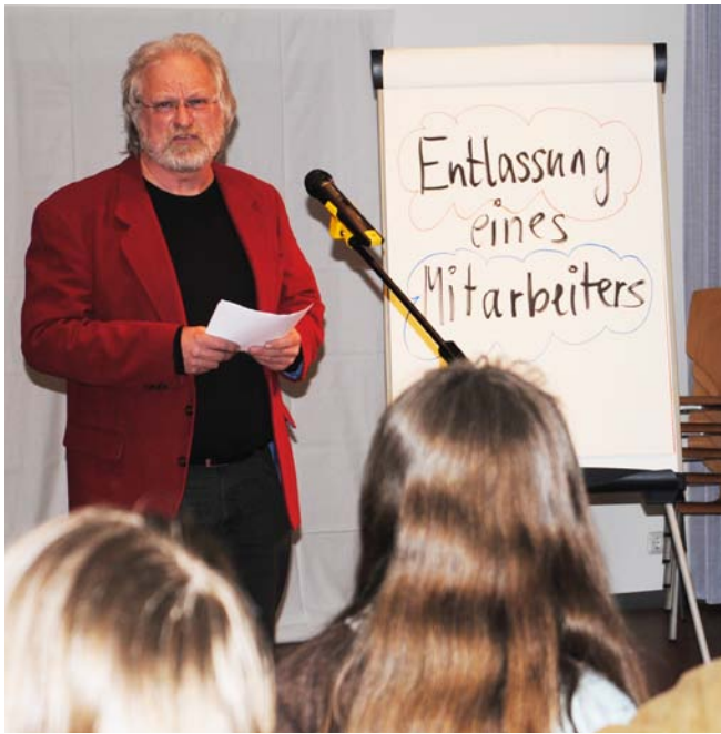
Alles eine Frage der Kommunikation: Mit der richtigen Rhetorik unangenehme Inhalte positiv vermitteln.