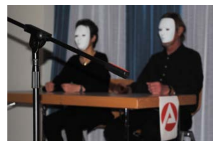
»In your hands« – wir haben es selbst in der Hand, unser Leben zu gestalten.