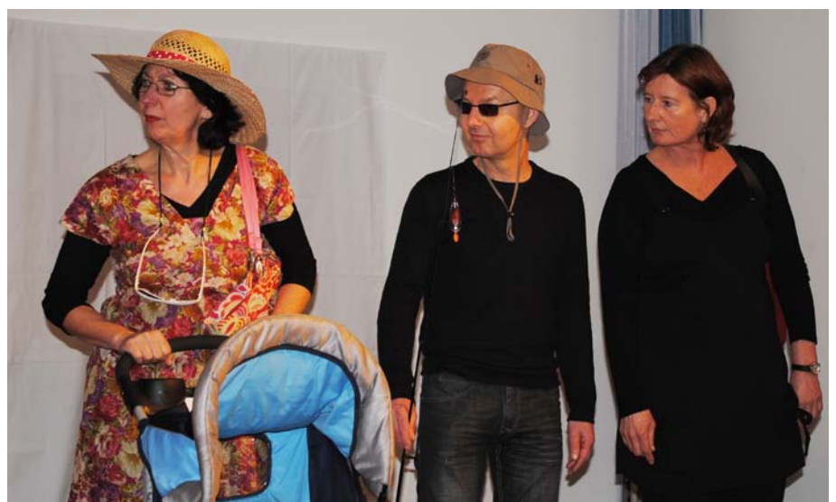
Verhinderte Badefreuden und Krokodile in der Nidda: der Fisch(steinkreis)l fängt zu stinken an beim Versuch, den Flüsterasphalt zu überqueren.