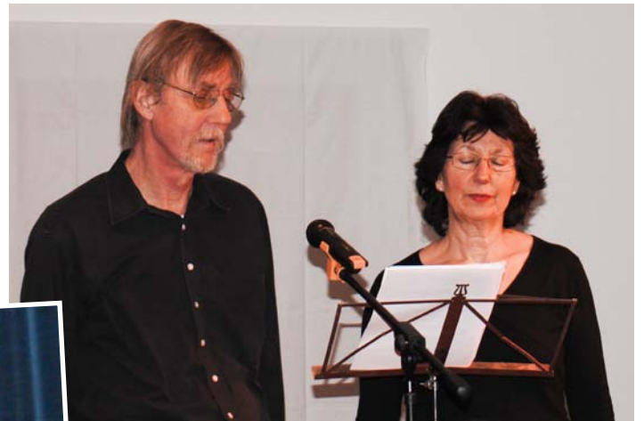
»Meine Freiheit jetzt, deine Freiheit nein.«